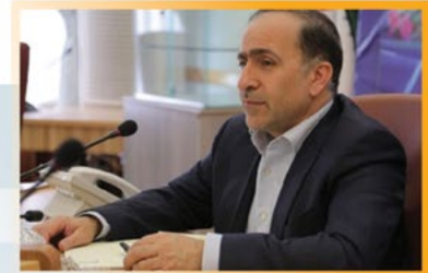
نایب رئیس شورای فناوری سلامت جناب آقای دکتر مصطفی قانعی